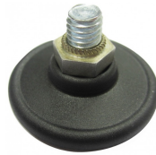
Nivelliergleiter mit Kunststoff von oben nicht sichtbar (Aussenbereich) N STAHL KSB 14