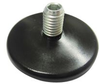
Nivelliergleiter mit Kunststoff von oben verstellbar (Aussenbereich) N STAHL KSI 6