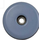
Teflongleiter genietet, nicht verstellbar N STAHL T