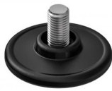
Nivelliergleiter Kunststoff ø 40/5 mm N STAHL KSB 11